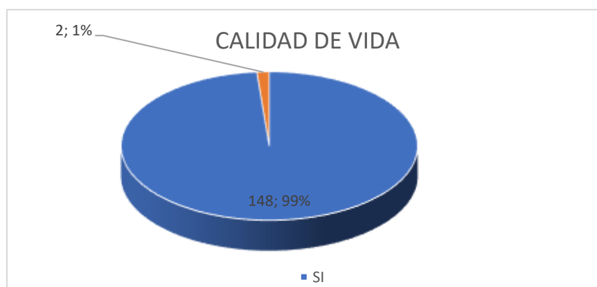
Fig. 2: Porcentaje de la calidad de vida

Fuente: Proyectos de Vinculación ejecutados en la Facultad de Jurisprudencia y Ciencias Sociales UTA