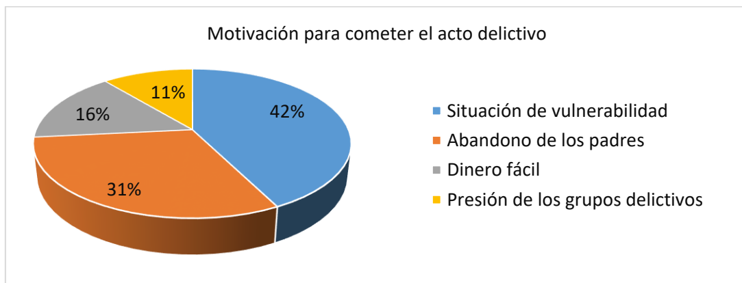
Fig. 2. Resultados